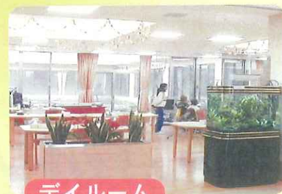
ダイニングルーム

在宅での療養を、なるべく長期で継続していただくために、エルサ上尾がお手伝いいたします。当施設の通所リハビリテーションでは、施設内で行う個別・集団リハビリを始めとし、レクリエーション・食事・入浴などのサービスを提供させていただくとともに、より良い在宅生活を送っていただけるよう、お手伝いさせていただきます。